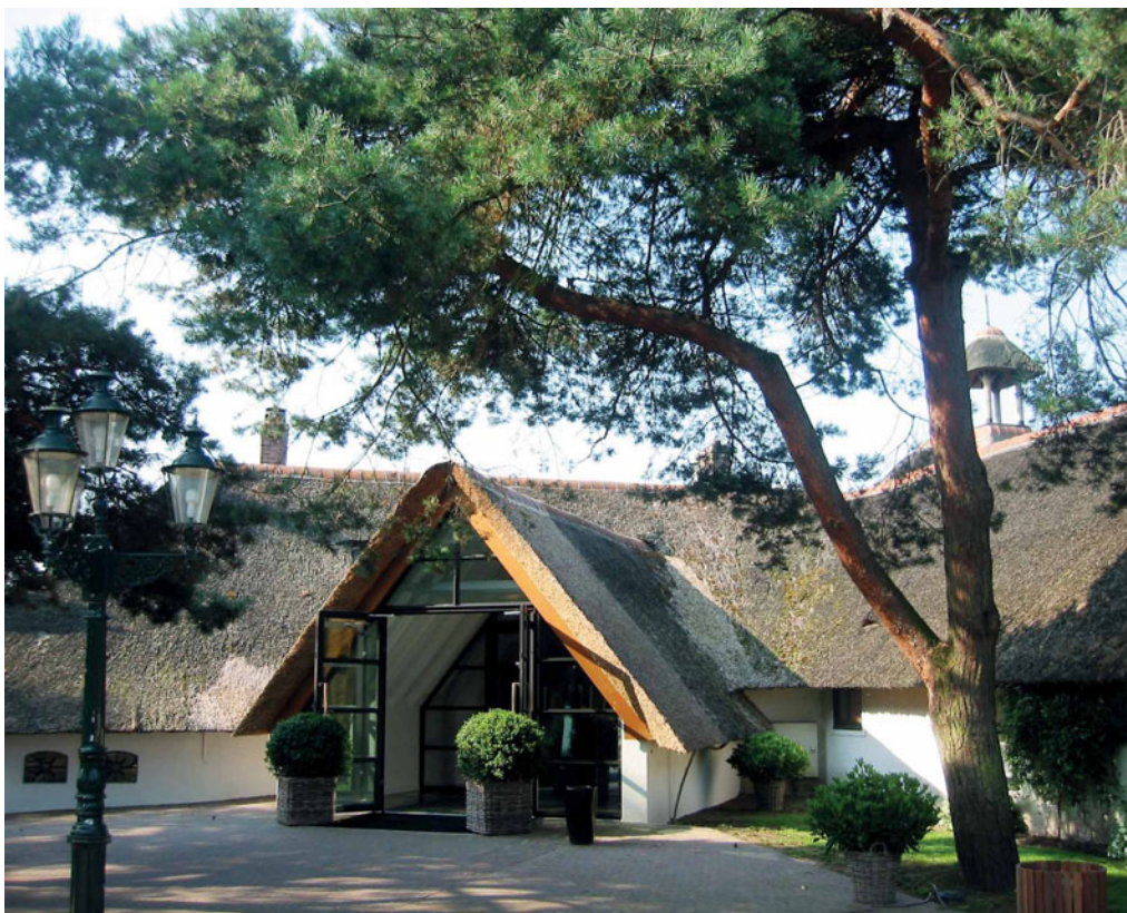
Congrescentrum Mooirivier in Dalfsen.